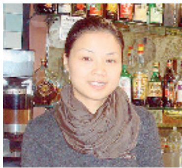
Xiao Fang Lou